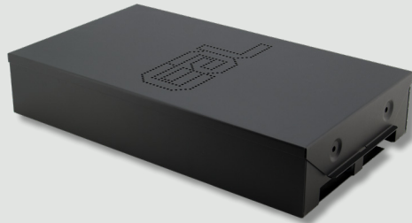
Vossessor-4 • standaard behuizing gesloten