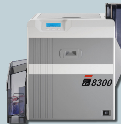
Retransfer Printer XID-8300